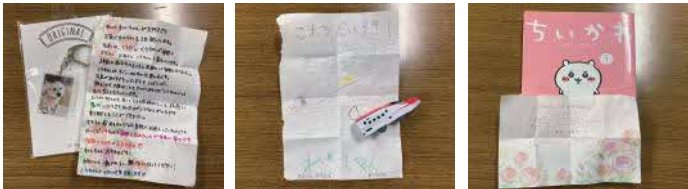
写真付きキーホルダー