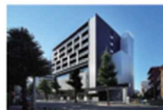
東京都生協連合会館（中野駅南口7分）

東京都生活協同組合連合会は、 地域生協、職域生協、医療生協、大学生協など 東京都内69の生活協同組合で構成されています